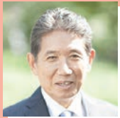
弁護士 前 戸田市長 神保国男