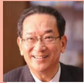
早稲田大学名誉教授/ 早大マニフェスト研究所顧問 北川正恭